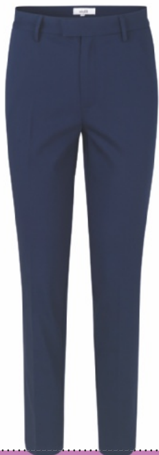
БРЮКИ из хлопка, МВУМ.