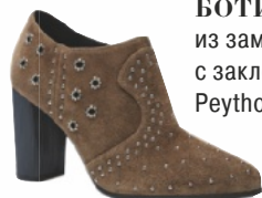
БОТИЛЬОНЫ из замши с заклепками, Python от Geox.