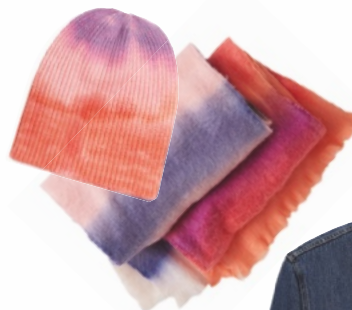
ШАПКА И ШАРФЫ с эффектом деградации, Gar.