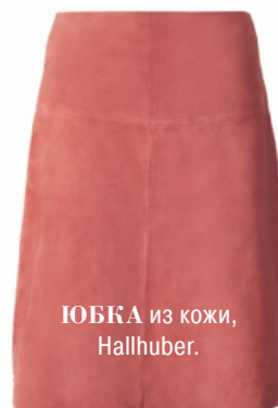
ЮБКА из кожи, Hallhuber.