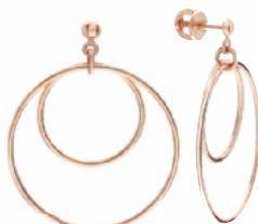
СЕРЬГИ из розового золота, коллекция «Золотое сияние» от Sunlight.