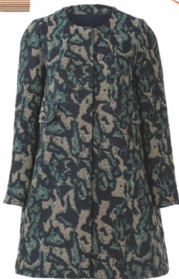
ПАЛЬТО из жаккарда, модель 104 со стр. 20.