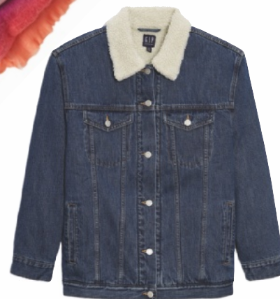
ДЖИНСОВАЯ КУРТКА на искусственном меху, Gar.