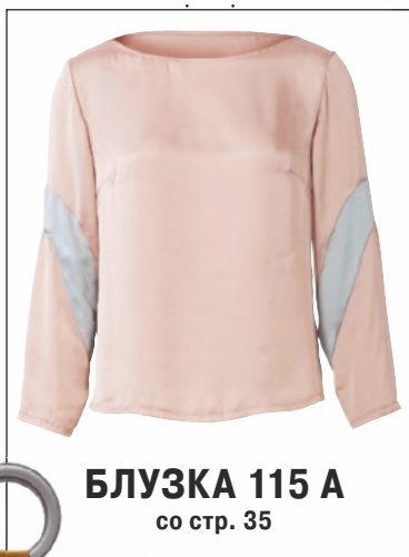
БЛУЗКА 115 А со стр. 35