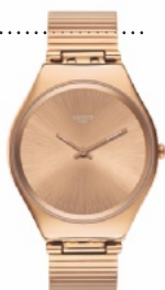
ЧАСЫ из нержавеющей стали, Swatch.