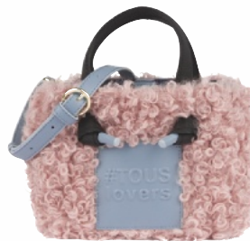
СУМКА из искусственного меха и винила, Amaya от Tous.