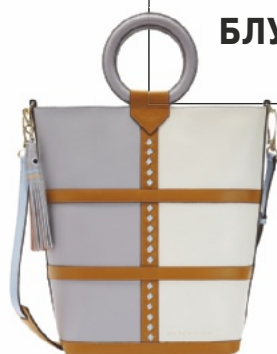
СУМКА из кожи, Ted Baker.